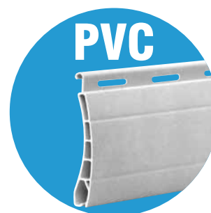
Lame PVC double paroi 37x8mm