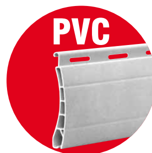
Lame PVC double paroi 37x8mm