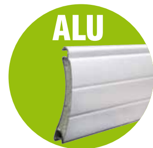
Lame ALU double paroi injectée de mousse isolante 39x8mm