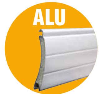
Lame ALU double paroi injectée de mousse isolante 39x8mm