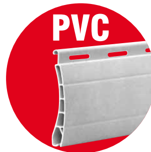
Lame PVC double paroi 37x8mm

* ALU : pose intérieure possible avec lame serrure en option : réf. A1/LF935INT